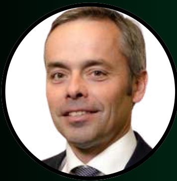
Pierre Jacquot Edmond de Rothschild REIM