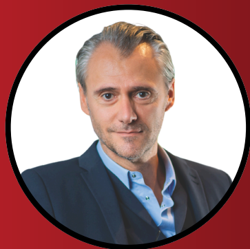
Franck Peyssonneaux AGEFI IMMO